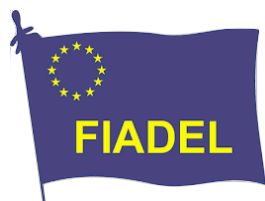
Federazione Servizi Igiene Ambientale